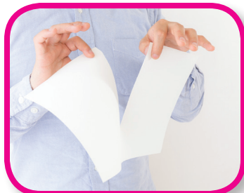
Aprender a desgarrar De 18 a 24 meses