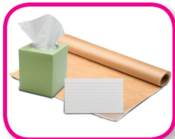
Desgarrar y comparar De 24 a 36 meses