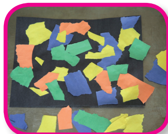
Creaciones con papel desgarrado De 30 a 36 meses