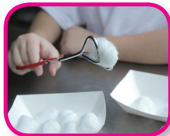
Prepararse para usar tijeras De 24 a 36 meses